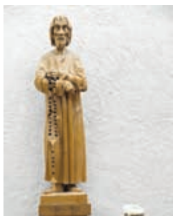
Verschnaufpause bei Bruder Klaus in der ökumenischen Bergkappelle im Wald.