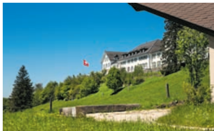
Vom Kurhaus gehts hinunter durch den Wald des «Goiferlätsch». Die Aussicht auf Aaretal und Berner Alpen lässt das Wasser im Mund zusammenlaufen.