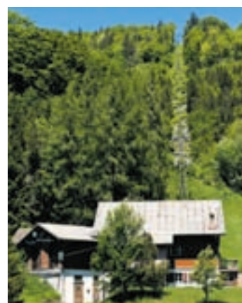
Vom Nesselboden führt ein herrlicher Gratweg hinauf zum Balmfluhchöpfli.