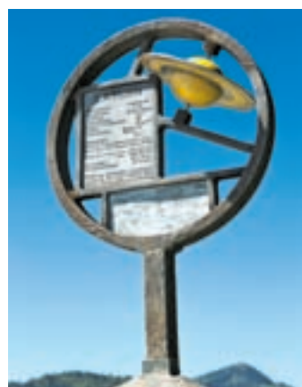
Auf dem Planetenweg ist der Saturn in einer halben Stunde erreichbar.