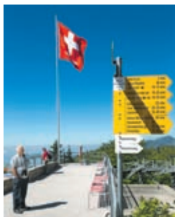
Von der Terrasse aus ist es quasi nur ein Katzensprung bis zur Hasenmatt.