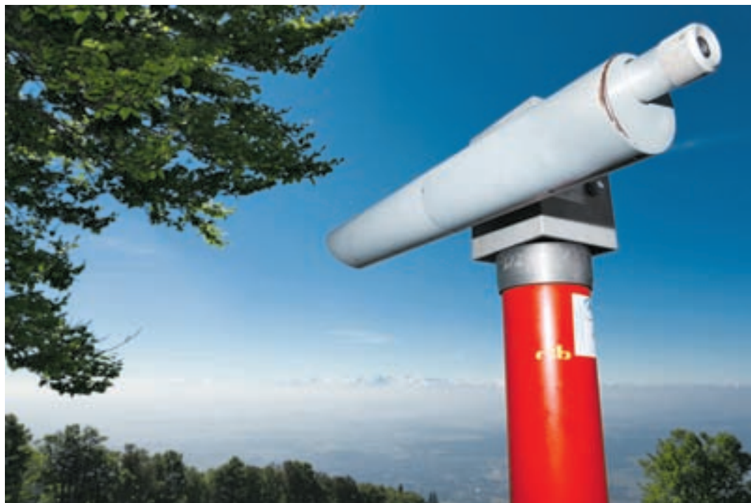
Mit einer kleinen Investition eröffnet sich dem Besucher auf der Aussichtsterrasse beim Kurhaus Weissenstein die grossartige Aussicht auf die Berner Alpen. Eigentlich ein unbezahlbar schöner Moment.

Seit 90 Jahren engagieren wir uns für die Erschliessung der Weissenstein-Balmberg-Region mit dem ÖV, eine lange und abwechslungsreiche Geschichte, die ich heute in vierter Generation mit einem Superteam weiterführe. Unsere Bergpoststrassen sind sehr anspruchsvoll, teilweise beträgt die Steigung bis zu 22 Prozent, ganz zu schweigen von den vielen Kurven. Da kommt dann das Posthorn zum Einsatz, das nicht nur die Kleinen freut. Bei vielen Fahrgästen werden schöne Erinnerungen wach. Unsere Region liegt mir sehr am Herzen, die Wälder und Hochweiden, die wilden und romantischen Schluchten und die vielen Aussichtspunkte sorgen zusammen mit dem Juragarten und einem Planetenweg für viele unmittelbare Erlebnisse – wir sind die Ambassadors dieser Region. Manchmal kreuzen unverhofft Wildtiere die Strecke, ganz selten ein Luchs. Ich halte dann kurz an und geniesse den Moment mit meinen Gästen. RH